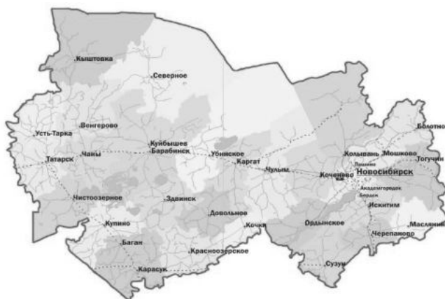
Рисунок 15.2.1 – Карта Новосибирской области

Основные реки области – Обь и Омь. Плотиной Новосибирской ГЭС образовано Новосибирское водохранилище (т. н. «Обское море»). Также в области расположено около 3 тыс. пресноводных, солёных и горько-солёных озёр (Чаны, Убинское, Сартлан и др). Север и северо-запад области занимает южная часть крупнейшего в мире Васюганского болота.